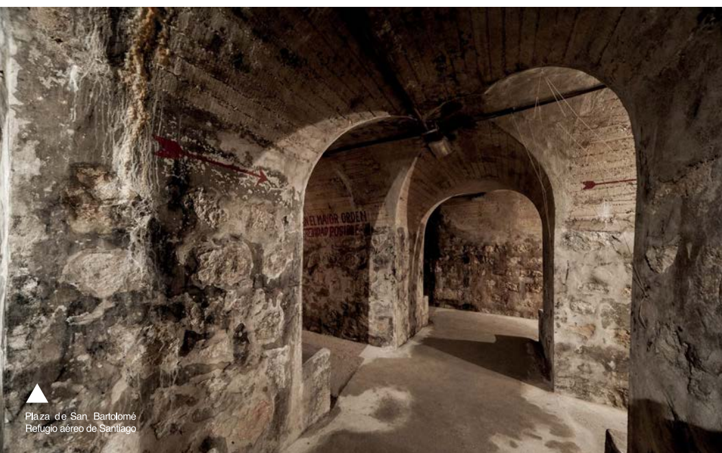
▲ Plaza de San Bartolomé Refugio aéreo de Santiago