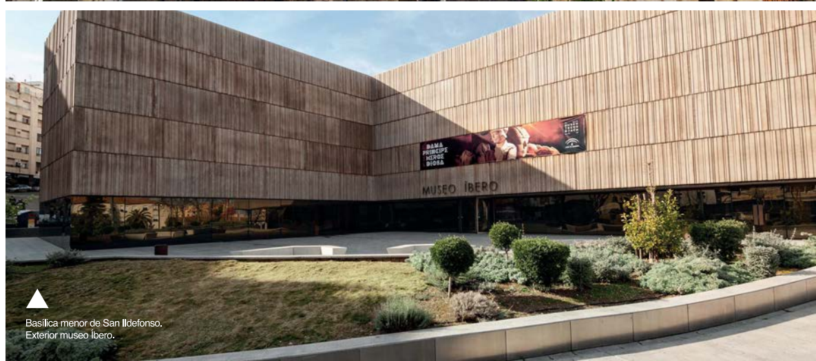
▲ Basílica menor de San Ildefonso. Exterior museo Ibero.